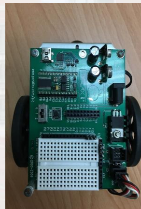
上圖為我們使用得BBCAR