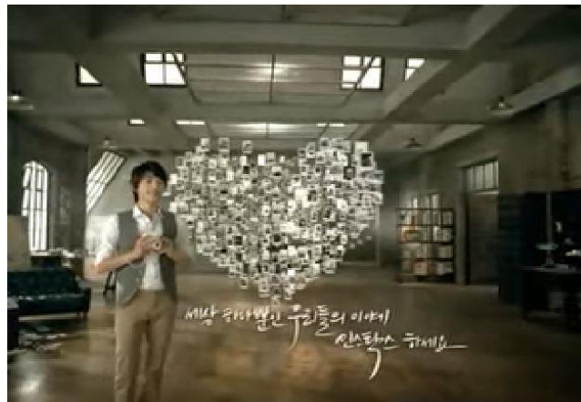
圖十一、十二、十三: instax mini8廣告

劇組構思:在劇情短片中，將拍立得作為故事中主要的媒介，透過拍立得的畫面引入男主角與觀看者，進入回憶的旅程，有別於第三人稱視角，以劇中男主角視野，在不同時期中，記錄下每一刻，每張拍立得都有屬於自己的溫度。在構思中，我們將運用案例一中的功能運用，加上案例二中的拍攝手法，最後結合案例三的故事結構，製作出畢業專題影片。另外預計舉辦拍立得照片競賽活動，活動目的是為了讓一般大眾更了解拍立得的獨特性，吸引購買人潮，擴大使用人口，致力推廣拍立得即刻列印真實照片的愉悅和樂趣。