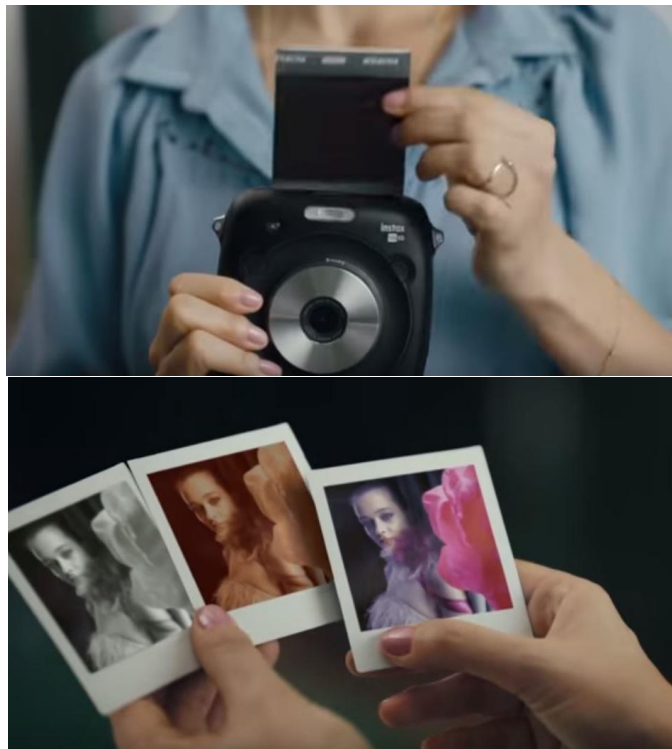
圖六、七：instax SQUARE SQ10廣告

案例一:在混合式數位相機instax SQUARE SQ10的廣告中，有將過去、當下，化創造力為有形，帶來嶄新的驚奇與喜悅。在一分鐘的廣告中，體現既有數位相機的完美操控感與構造，又能確實體會到即刻列印真實照片的愉悅和樂趣。