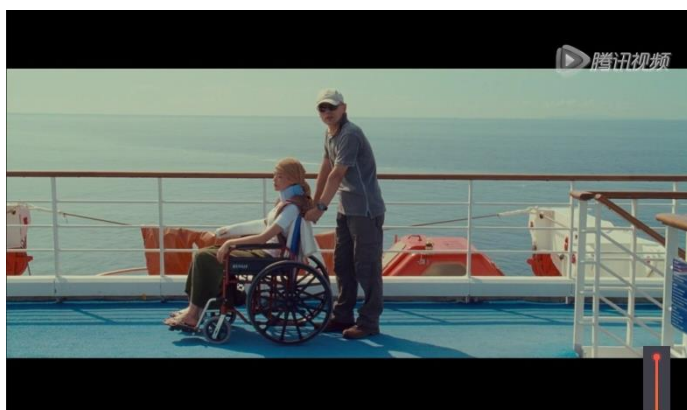
圖四：「與你相戀的一百天」