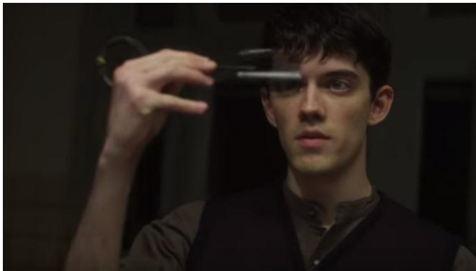
圖八、九、十: Polaroid 品牌廣告

拍攝手法和演員技巧猶如電影般細膩，讓人不只是在看廣告，而像是看電影一般，讓觀眾沈浸在故事的氛圍中。